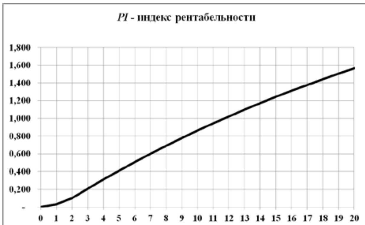
Рис. 2. Динамика индекса рентабельности PI_T Fig. 2. Dynamics of the Profitability Index PI_T

Данный показатель является безразмерным, а с точки зрения информативности он полностью эквивалентен NPV . К концу горизонта планирования этот показатель достигает значения 2,25. Ниже показана кривая зависимости PI_T .