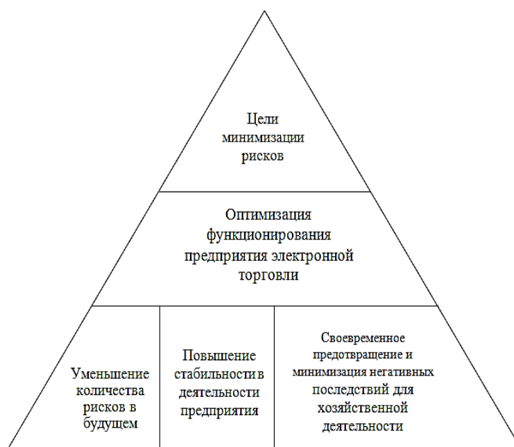
Рис. 1. Система целей минимизации рисков в электронной торговле Fig. 1. The system of objectives to minimize the risks in e-commerce

Для упреждения возможных потерь электронной торговли различают следующее подходы к минимизации рисков: активное управление, адаптивный подход, консервативный подход.