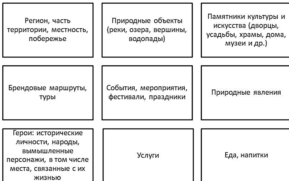
Рис. 2. Типы туристических брендов Fig. 2. Types of tourist brands