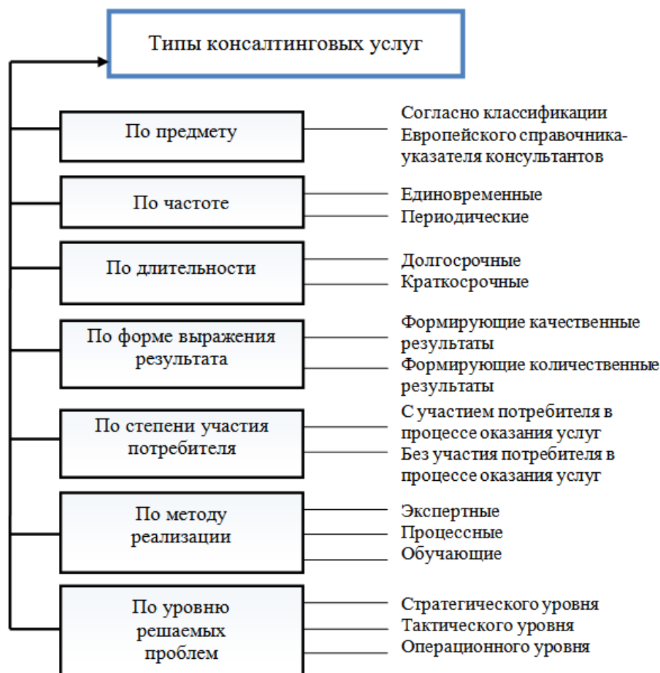
Рис. 2. Типы услуг управленческого консалтинга Fig. 2. Types of management consulting services

В экономической литературе представлен еще один способ структуризации консалтинговых услуг (рис. 2). Предложенная авторами (Селютина, Песоцкая, 2011: 175) типология обобщает ряд типологических критериев и выделяет наиболее существенные из них. Данный способ структуризации представляет систематизированные оценки, полезные для различных сфер деятельности, в том числе и сферы НПО.