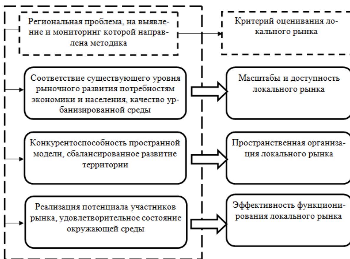
Рис. 1. Карта взаимосвязи региональных проблем и критериев оценивания локального рынка