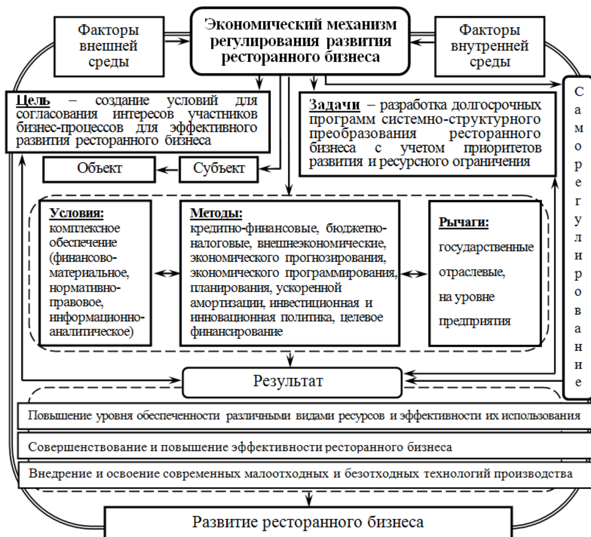
Рис. 3. Экономический механизм регулирования развития ресторанного бизнеса Fig. 3. Economic mechanism for regulating the development of the restaurant business

Комплексное использование бюджетно-налоговых и финансово-кредитных рычагов (Губерная, 2012; Чумаченко и др., 1999) позволит Республике достаточно эффективно регулировать экономическое развитие ресторанного бизнеса как самостоятельной системы торгово-производственного комплекса. Донецкая Народная Республика пока не может «похвастаться» развитой кредитной системой. Только в 2017 г. была активизирована работа по развитию системы кредитования (Постановление ЦРБ ДНР № 295 от 05.10.2017 г.) и были утверждены правила предоставления финансовыми учреждениями финансовых кредитов юридическим и физическим лицам за счет собственных денежных средств. Сегодня в период пере-