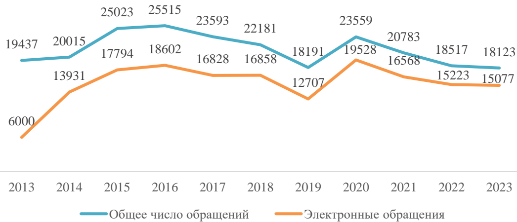
Рисунок 1. Динамика обращений граждан в регионе Свердловская область, 2013-2023 гг. Figure 1. Dynamics of citizens' appeals in the Sverdlovsk region, 2013-2023