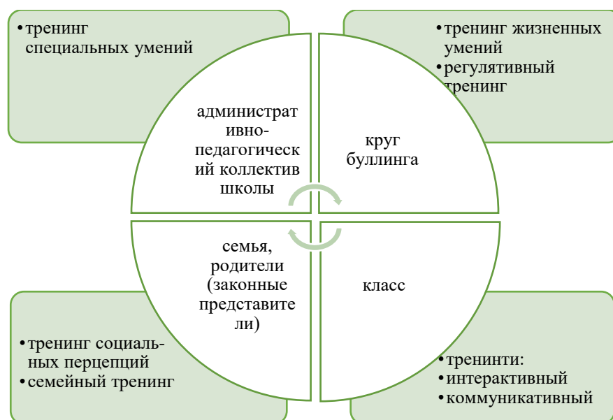
Рис. 1 Модель антибуллинговой компетентности в условиях образовательных организаций Fig. 1 The model of anti-bullying competence in educational institutions