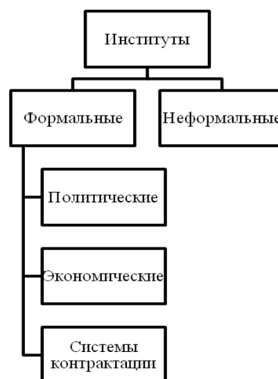
Рис. 2. Типология институтов Fig. 2. Typology of institutions

Оливер Уильямсон трактует институты как как механизмы контрактных отношений фирм, рынков в свете развития новаторской теории институциональной экономики [5].